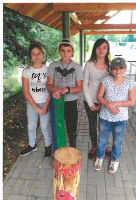
Žáci a paní učitelky ZŠ