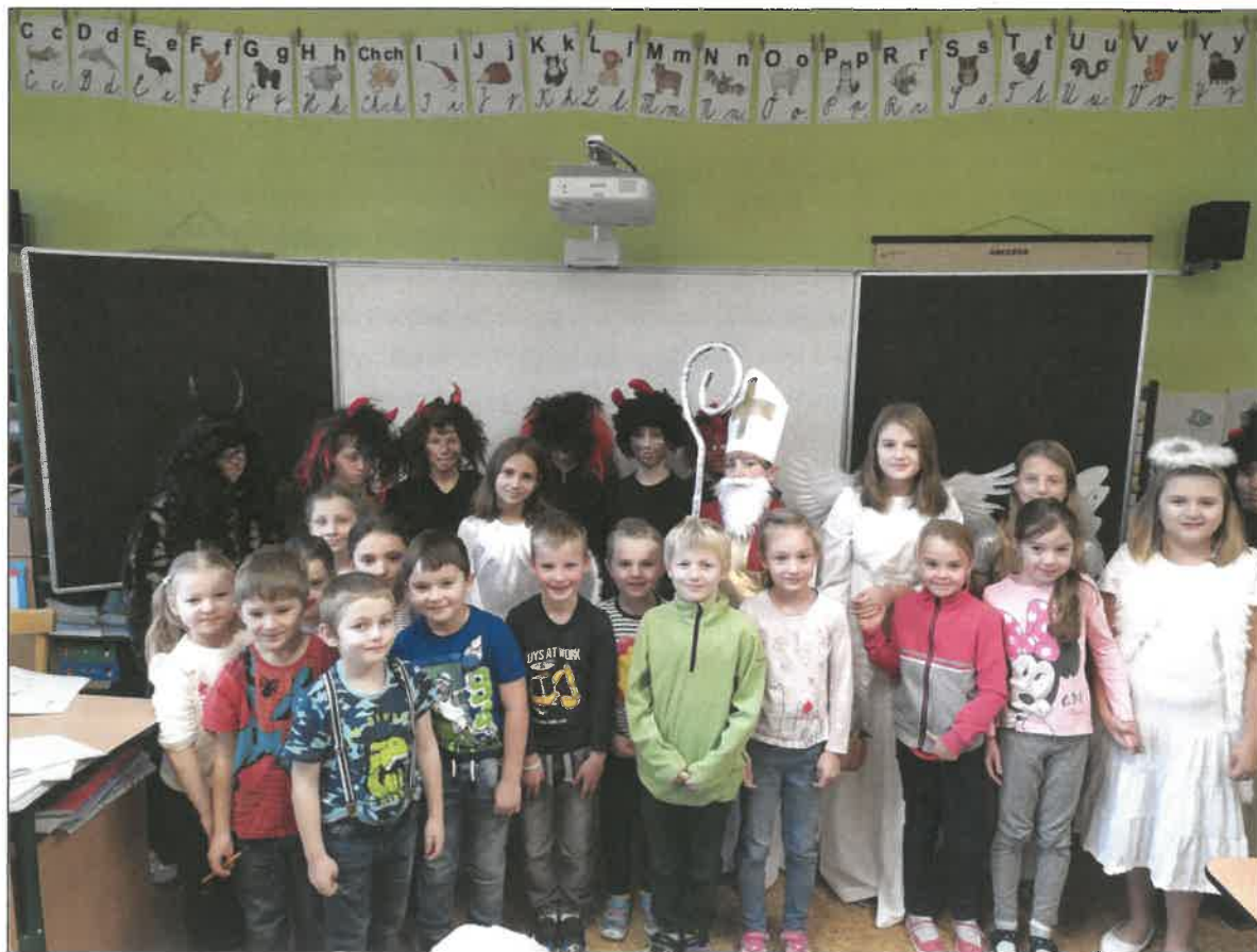
Klidné sváteční dny a v novém roce pevné zdraví nám všem.