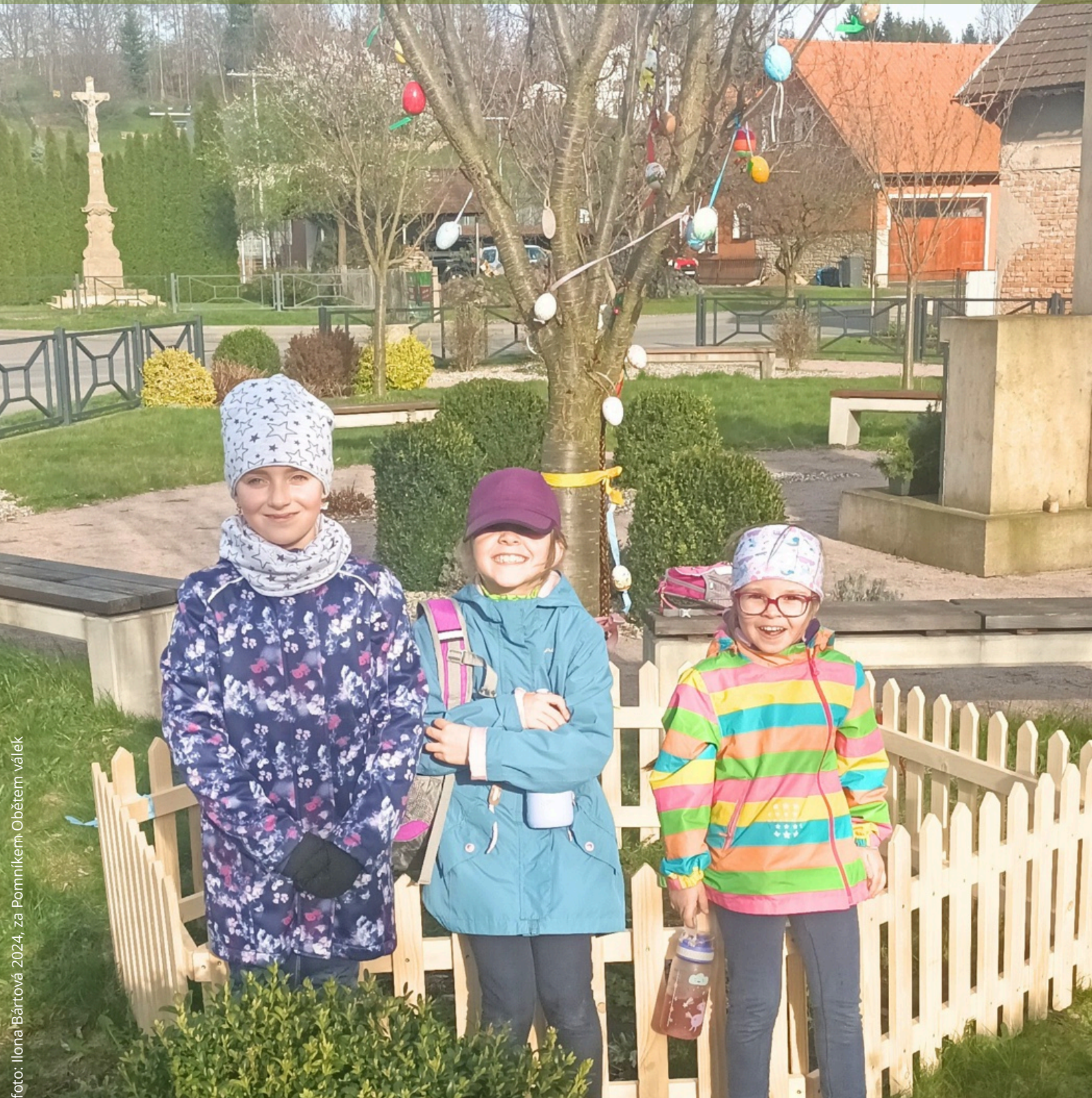
za Pomníkem Obětím válek