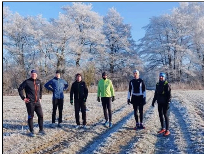
Fotky z obou akcí naleznete na Facebooku našeho atletického oddílu.

A v letošním roce máme za sebou již také několik úspěšných akcí. O atletických závodech v hale, kterých se účastní děti z atletického oddílu, o atletických vícebojích pro děti v Dlouhé Třebové nebo o výletech oddílu starších žen se dozvíte v samostatných článkách jednotlivých oddílů. Co ale určitě můžeme ještě zmínit, je taneční vystoupení oddílu mladších žákyň na hasičském plesu v Dlouhé Třebové. Dívky nacvičily dvě zbrusu nové skladby, které byly na úvod plesu předtančeny a velmi se jim povedly. Dívky si atmosféru plesu i závěrečný potlesk opět hezky užily a my tímto děkujeme za spolupráci s SDH Dlouhá Třebová, který ples pořádá a dívky tak mají možnost předvést, jak moc jsou šikovné a co se během poměrně krátké doby zvládly naučit.